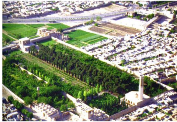
تصویر (۱): اندرونی باغ دولت‌آباد

علاوه بر توضیحات فوق، اصول پایداری محیطی در طراحی منظر مناطق اقلیمی گرم و خشک، درسه نظام