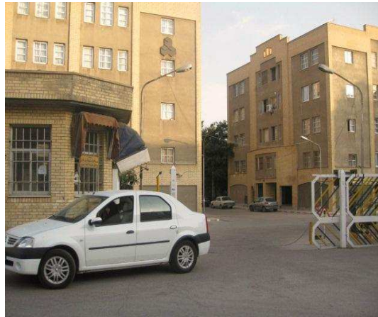
تصویر (۳): مجتمع مسکونی دوستان

طبق برداشت‌ها و نیز مصاحبه به عمل آمده از ساکنین، به دلیل موقعیت قرارگیری و طراحی نامناسب، به ندرت