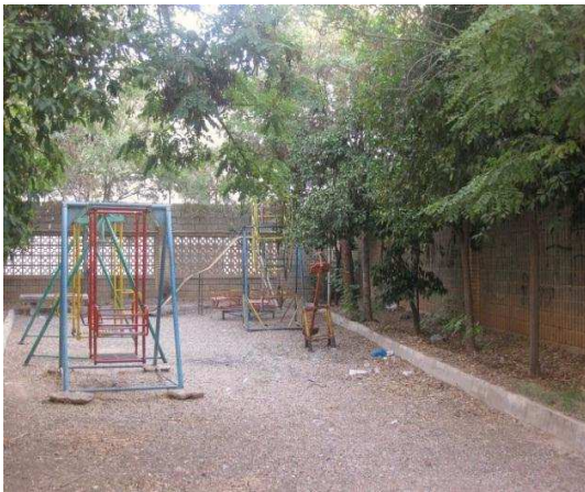
تصویر (۴): زمین بازی مجاور مجتمع مسکونی به عنوان تنها فضای همگانی که به دلیل عدم بهره‌مندی از کیفیت‌های برشمرده، کمتر کسی از آن استفاده می‌کند.

مورد استفاده قرار می‌گیرد و در بیشتر اوقات خالی و خلوت است (تصویر ۴).