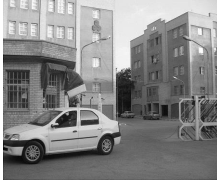
تصویر(۳): مجتمع مسکونی دوستان

بر اساس اطلاعات به‌دست‌آمده از بخش مابانی نظری، دو شاخص جذابیت و امکان