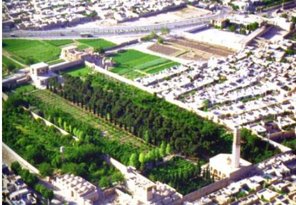
تصویر (۱): اندرونی باغ دولت‌آباد

موجب حفظ رطوبت باغ می‌شود و بدان کیفیت همانند یک اکوسیستم بسته (همان). در باغ دولت‌آباد جریان آب بارها به درون زمین برده شده و تنها در مواقع